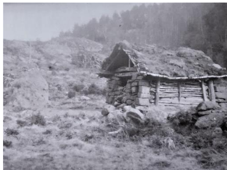
Landsdalstølen med høyløe og høystakk t.v. Denne stølen lå i heia, mellom østre ende av Mjåvatnet og Ørdsdalsvatnet.