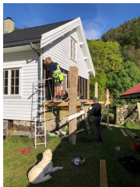
Ny ytterkledning på Huset.