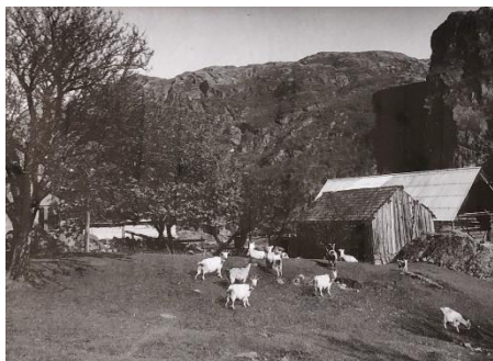
Landsdal 1959.

Nye bilder legges ut fortløpende, så følg med!