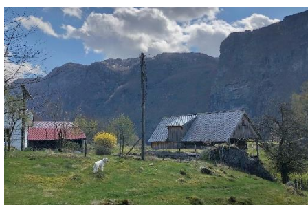
Landsdal 1. mai 2021. Foto tatt fra samme staden som foto 1959 av Magnus Espedal.