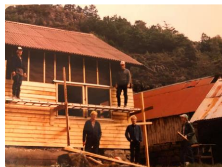
Svært gode hjelpere, søsken barn og far deira Evevald Spødervoll - vi (dei) bordkler siste rest av huset - ein laurdag i oktober 1983.