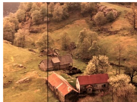
Landsdal pisen 1983 når de nettopp har overtatt plassen.