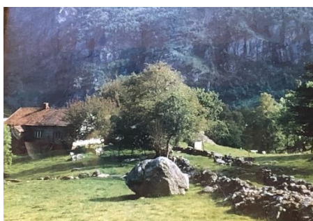
Landsdal 1974.