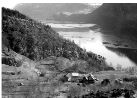
Landsdal våren 1964. Utsikt innover vatnet mot Lauperak.